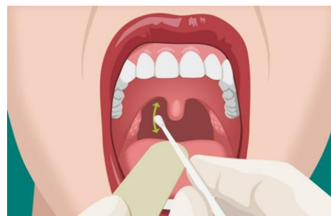
Hình 2: Lấy mẫu ngoáy dịch họng