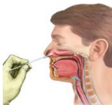
Hình 3. Lấy mẫu ngoáy dịch mũi